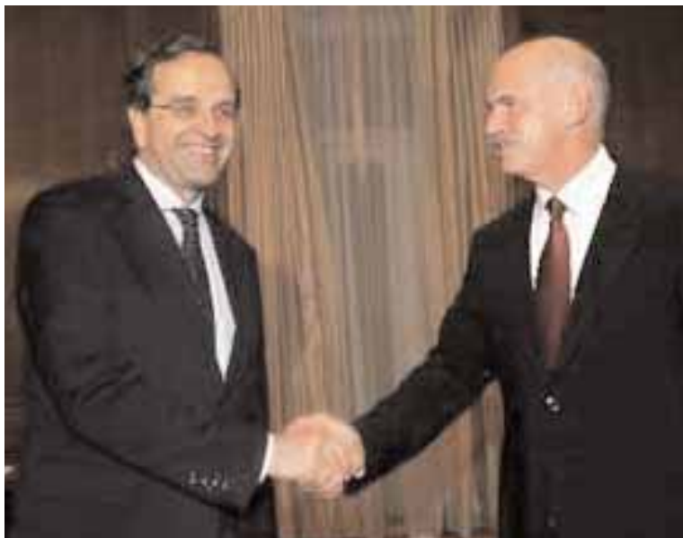
Από τη συνάντηση του Γ.Παπανδρέου με τον Αντ.Σαμαρά

νεοεκλεγείς πρόεδρος της αξιωματικής αντιπολίτευσης συναντάται την ημέρα ανάληψης των καθηκόντων του με τον αρχηγό του κυβερνώντος κόμματος.